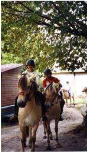
Ferme de découverte de la route du Lac à La Ville aux Bois lès Pontavert (02)