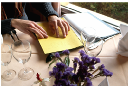
Carte en braille au restaurant Royhotel (Roye, 80)