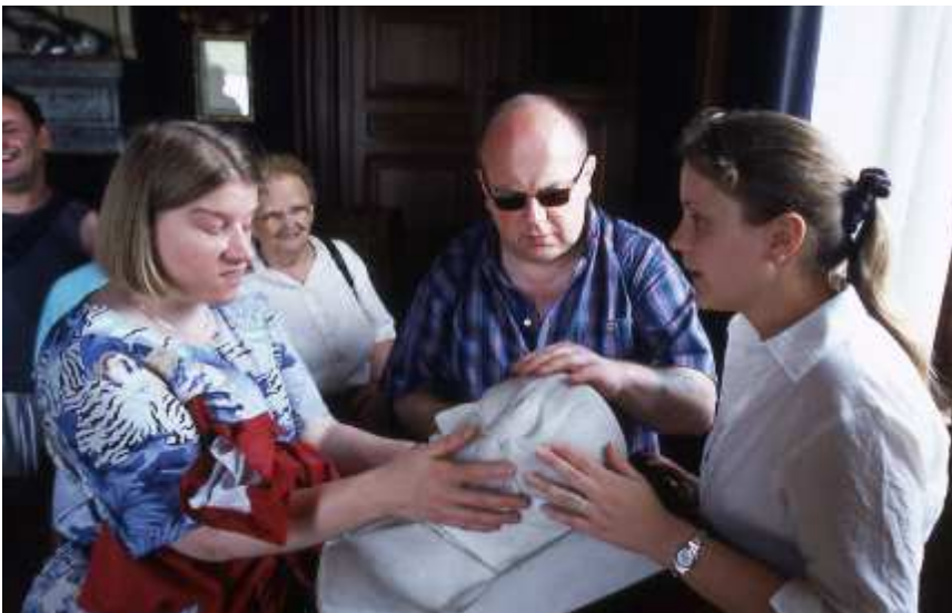
Visites tactiles au musée Condé à Chantilly (60)

En France, l'Association Tourisme & Handicaps y travaille activement depuis 2001. En leur apportant la garantie d'un accueil adapté, le label Tourisme & Handicap répond à la demande des personnes handicapées qui veulent pouvoir choisir leurs vacances, se cultiver, se distraire, partir seules, en famille ou entre amis, où elles le souhaitent, comme tout le monde et avec tout le monde.