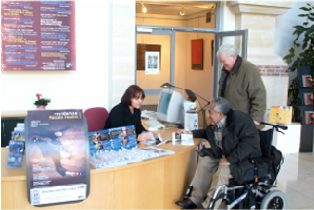
Accueil au Théâtre du Chevalet à Noyon (60)

Le mode de consommation de vacances, d'activités culturelles ou sportives des personnes présentant un handicap est comparable à celui des personnes valides : il dépend avant tout de l'âge et des revenus.