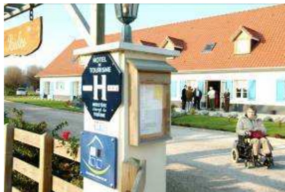
Hôtel Les Saules à Favières (80)

« Notre requête est la suite logique d'une démarche qui a duré une année et qui a été menée avec différents prestataires. Nous avons souhaité rendre notre site accessible à tous, que ce soit pour une personne âgée avec des difficultés de mobilité, pour une famille avec des enfants en poussette ou pour une personne en fauteuil roulant ».