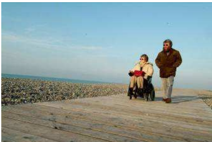
Cheminement sur la plage de Cayeux sur Mer (80)