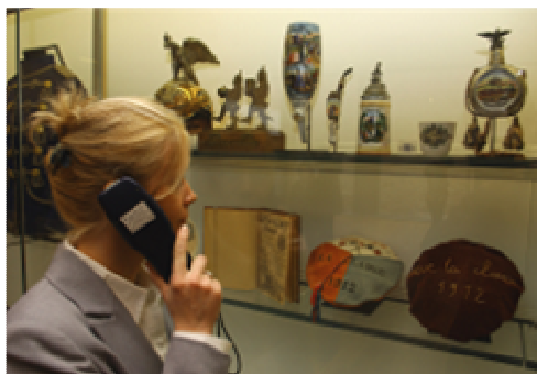
Audioguide à l'Historial de Péronne (80)