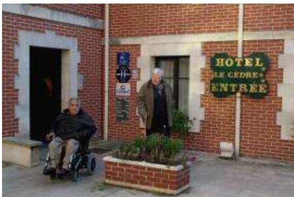
Hôtel Le Cèdre à Noyon (60)

maximale de cinq ans, renouvelable après contrôle du maintien des critères d'accueil et d'accessibilité.